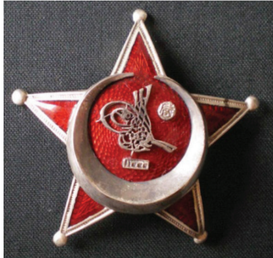
Resim 6. Harp Madalyası

Harp Madalyası, Birinci Dünya Savaşı'nda Osmanlı cephelerinde üstün cesaret ve kahramanlık gösteren Osmanlı ve İttifak Devletleri askerlerine Sultan Mehmet Reşat tarafından 1 Mart 1915'te verilen bir askeri nişandır ve Osmanlı İmparatorluğu'nun son madalyasıdır. Madalyanın ön yüzünde beş köşeli kırmızı bir yıldız, onun ortasında gösterişli bir hilal vardır. Hilalin iç bükeyinde Sultan Mehmet Reşat'ın tuğrası bulunmaktadır. Ayrıca tuğranın altına, Hicri takvime göre madalyanın verildiği 1333 (1915 M) yılı işlenmiştir (Resim 6).