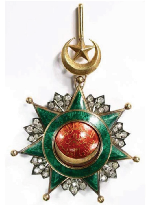
Resim 1. Birinci dereceden murassa Osmani Nişanı

Nişan-ı Osmani birçok özellikleri ile öncekinden farklılıklar gösteriyordu. Gümüştan yapılan bu nişan yeşil mineli ve yedi köşeli bir yıldız şeklindeydi (Resim 1). Orta kısmı kabarık olan nişanın kırmızı mine üzerinde "El-müstenid bi't-Tevfikat-ı Rabbaniye, Abdülaziz Han, Melikü'd-Devleti'l-Osmaniye" (Osmanlı Devleti'nin hükümdarı, Allah'ın yön göstermesine dayanan Abdülaziz Han) yazısı yer alıyor, bu yazının altında ise bir yarım ay bulunuyordu. Bunu yeşil mineli bir halka çevreliyordu. Nişan-ı Osmani de devlet hizmetinde başarı göstermiş kişilere iftihar ve imtiyaz olmak üzere çıkartılmıştı.