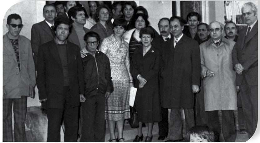
Dispanser acilisi 1977

Ona gelen hastaların büyük çoğunluğu ciddi bir hastalıkları olmadıklarını hissederek onun yanından ayrılırlardı.