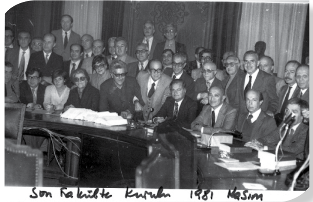
Son Fakülte Kurulu 1981 Kasım